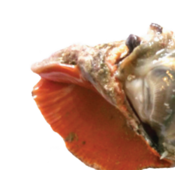
קונכיית ארגמונית אדומת פה

אבותינו לא עשו עניין מההבדל בגוונים בין תכלת של ארגמן חד קוצים ובין זה המופק מקהה קוצים או מארגמונית, וכולם נכללו בתחום התכלת הלגיטימי. נראה שהם היו פחות קפדניים מאיתנו בעניין הזה. רק אנהו אוהבים להתווכח על קצו של חילון".