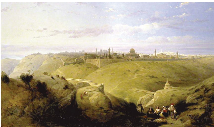
"ריקוד גדול במעגל, בניגון". הר הבית, 1839, כפי שצויר בידי דייוויד רוברטס

אבותינו לא עשו עניין מההבדל בגוונים בין תכלת של ארגמן חד קוצים ובין זה המופק מקהה קוצים או מארגמונית, וכולם נכללו בתחום התכלת הלגיטימי. נראה שהם היו פחות קפדניים מאיתנו בעניין הזה. רק אנהו אוהבים להתווכח על קצו של חילון".