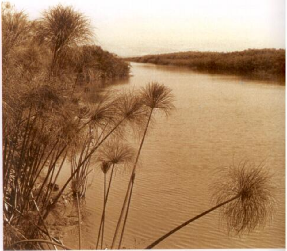
נומא בחולה.