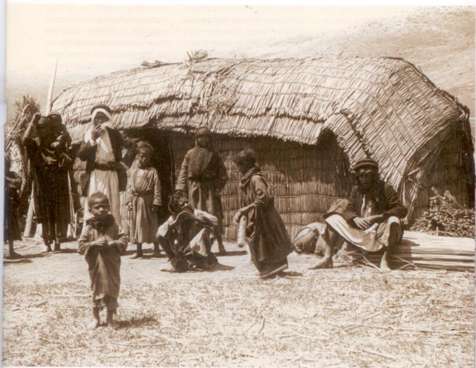
עמק החולה: בדווים ליד חושה בנויה מנומא.

והסיר את ראשו מעליו. את גופתו השליכו השודדים באגם קדש, היא ימת החולה, בין העשבים.