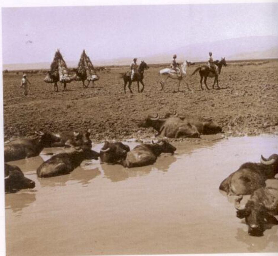
מימין: עמק החולה על רקע החרמון, 1937. חשמאל: ג'מוסים בביצת החולה, 1946.

ויאמרו לו: למה לא יצאתם היהודים כמנהגכם לבקש ליהודי אחד שנהרג כאן זה זמן, כמו ח' או ט' חודשים? ויאמר להם חסן הנוכח: היאך היה המעשה ולמה הרגוהו?