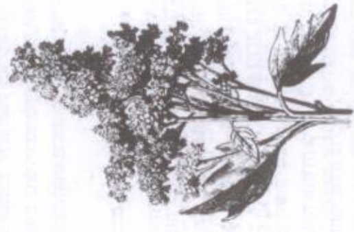
איור מס' 40: קינואה ( Chenopodium quinoa )

כשנים האחרונות התפשט בעולם המערבי השימוש בגרגירי צמח הקינואה ( Chenopodium quinoa ) למאכל, ועד מהרה הוא תפס מקום נכבד גם בסל המזון הישראלי. הקינואה היא צמח ממשפחת הירבוניים ( Amaranthaceae ), 43 שאין לו כל קשר למשפחת הדגניים. זהו צמח חד-שנתי גבוה הנושא תפרחות דמויות מכבד. הצמח עמיד מאוד ומסוגל לנבט ולהפיק יבולים במגוון תנאי אקלים. מוצאו של הצמח באזור הרי האנדים שבדרום אמריקה, שבהם שימש כמקור מזון ומקורש וחשוב לילידי המקום. בקרב בני האינקה הוא מכונה "אם הדגן". בשווקים נמכרים בעיקר זרעי הקינואה, אך גם העלים שלו נאכלים.