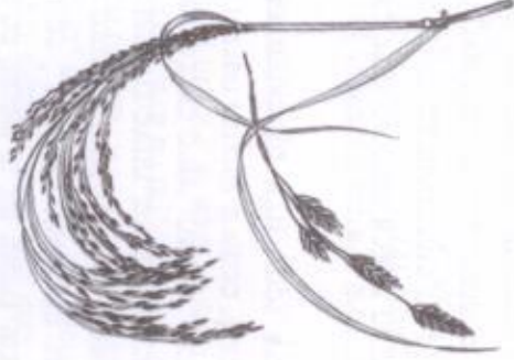
איור מס' 37: בן-הילף חבשי ( Eragrostis tef ), הלוא הוא דגן הֶטֶף

יהודי אתיופיה העלו עמם לארץ-ישראל מסורת של אכילת מאכלים שנהגו לאכול בארץ מוצאם. המאכל המסורתי השכיח ביותר באתיופיה הוא האֶגְרִיסָה העשויה מזעי דגן הֶטֶף, שהוא מעין פיתה שטוחה, דקה ומחוררת (כדומה לפנקייק או לֶחֶזֶח התימניות), ושמה המצמץ. יש העושים את האגרידה על סהרת הֶטֶף, ויש מי שמערבים אותה עם מיני דגנים אחרים או עם גֶרְגֵרֶנֶת הַתְּלָקָה ועוד. האגרידה היא הלחם העיקרי של יהודי אתיופיה, והיא נאכלת עם רוטב מתובל (וואט) עם מגוון מאכלי בשר וירקות ועוד. באזורים שהֶטֶף שכיח באתיופיה, נהגו לעשות ממנו מצות לפסח. את גרגרי הֶטֶף קונים יהודי אתיופיה בארץ בחנויות מיוחדות, ומקורו ביבוא מאתיופיה. מטבע העניין עלתה בארץ שאלת הברכות שיש לברך על המאכלים העשויים ממנו. כאן נתמקד רק בשאלת ברכת הלחם העשוי על סהרת גרגרי הֶטֶף. 1