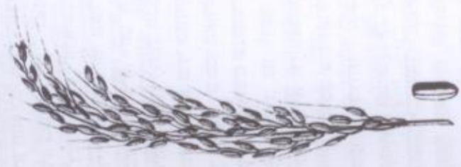
איור מס' 38: אורז ( Oryza sativa ) תן דעתך לגרגיר המחויץ

האורז ( Oryza sativa ) הוא גידול חדש באופן יחסי, שהוכנס לתרבות החקלאית של המזרח הקרוב בתקופה ההלניסטית, ומאו מגדלים אותו בארץ-ישראל עד לעת החדשה באזורים מוצפי מים. 15 האורז נמנה היום עם משפחת הדגניים, אף על פי שלדעת חכמים אינו נמנה עם חמשת מיני דגן, ולכן לא חלים עליו כל הדינים החלים על המינים האלה. ר' יוחנן בן גורי משקף דעת יחיד, שהאורז הוא מין דגן מבחינה הלכתית שברכתו "המוציא לחם מן הארץ", 16 שחייבים על חימוצו כרת, ואדם יוצא ידי חובה באכילת מצה ממנו בפסח. 17 אמנם יש לאורז גרגיר מאורך ומחויץ בדומה לשאר חמשת מיני דגן, ומכאן הגדרתו כמין דגן בשיטת ר' יוחנן גורי. אף על פי שלא התקבלה להלכה, ומשום כן, ניתן לו מעמד מיוחד והיו דיונים מיוחדים בשאלת הברכה עליו והעניינים אחרים. למשל בשאלת כסיסת האורז, יש מחלוקת בין הבבליים 18 לבין היושלמיים, 19 ואילו בקשר לחם אורז קבעו חכמים שברכתו "בורא מיני מזונות", ואילו לדעת רב ושמואל, המשקפת את דעת המיעוט, ברכתו "שהחל נהיה בדברו". 20 מעמד המורעף של האורז נקבע גם השיבותו התזונתית הרכה. 21 ומאחר שהטף אינו מוגדר כאורז מבחינת זיהויו, וגם השיבותו התזונתית אינה רכה, 22 הרי שלכאורה, אפילו לפי דעת חכמים, אין לברך "בורא מיני מזונות" על לחם הנעשה מן הקמח שלו.