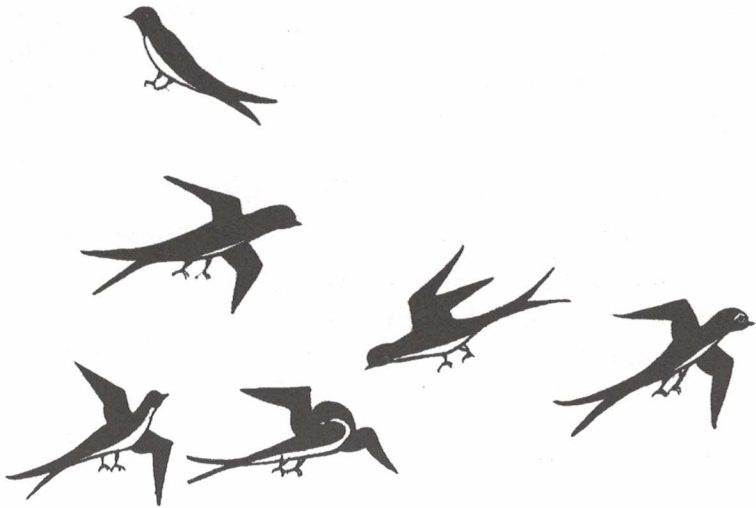
עופות הקרויים בערבית 'ח'טאטיף' (היחיד: 'ח'טאף') – מתוך חיבור ערבי משנת 1462

אגב, אהרוני מביא הוכחה מהמקרא ש"הציפור" או ה"דרור" הוא דרור הבית 31 ואינו זהה לסנונית. את הפסוק 'כצפור לנוד, כדרור לעוף' – כן קללת חנם לא תבוא' (משלי כו ב) הוא מפרש: כשם שציפור אינה נדה ודרור אינו עף – כך קללת חנם לא תבוא. אהרוני מציין שהדרור היא ציפור יציבה שאינה נודדת ממקום למקום אפילו בארץ. לעומת זאת, הסנונית נודדת ומזוהה על פי תרגום 'יונתן' עם ה"עגור" (ירמיהו ח, ז). 32 כמו-כן התכונה