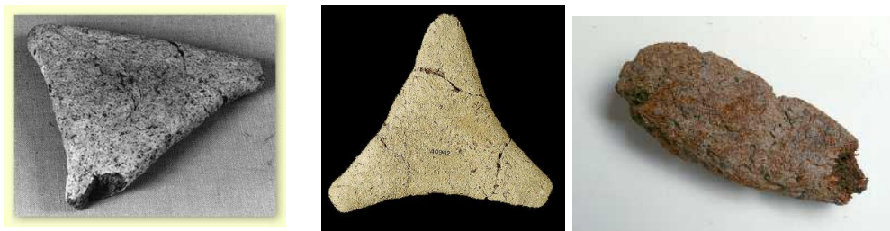
ככרות לחם ממצרים העתיקה

כְּמַעֲשֵׂה אֶרֶץ מִצְרַיִם אֲשֶׁר יִשְׁבַּתֶּם בָּהּ לֹא תַעֲשׂוּ, וְכַמַּעֲשֵׂה אֶרֶץ כְּנָעַן אֲשֶׁר אָנֹכִי מְבִיא אֶתְכֶם שָׁמָּה לֹא תַעֲשׂוּ וּבְחַקְתֶּיהֶם לֹא תִלְכוּ.