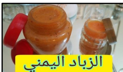
פרסום של "זבאד אלימני" בימינו

נשות בֵּיחאן שבדרום-מזרח תימן היו נוהגות למרוח באצבען פס מבושם הזבאד מעל הלחיים. הבושם היה מדיף את ריחו באיטיות, שכן בשבת עצמה היה אסור להתמרח במרקחות קוסמטיות. 8 גם בימי שמחה התקשטו הנשים והתמרחו בבושם הזבאד והמושק על הצוואר. 9 כיום נוהגות הנשים בתימן להשתמש בו גם כמרכך שיער, למניעת נשירה וקשקשים. בחידאן ובאינדיר עיטרו הנשים את פניהן במשחות צבע ריחניות. העיטור כלל ציור נקודה בין