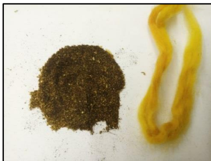
אבקת צמח ה'ורס' וצמר הצבוע ממנו (זהר עמר)

בספרות היהודית בימי הביניים זוהו מונחים שונים מהמקרא ומהמשנה עם ה'ורס'. בתרגום הערבי של רס"ג תורגם בשם זה ה"נרד". 21 גם בפירוש מילים למשנה הקרוב לבית מדרשו של רס"ג מתורגמת המילה "צינית" (שבת ו, ו)