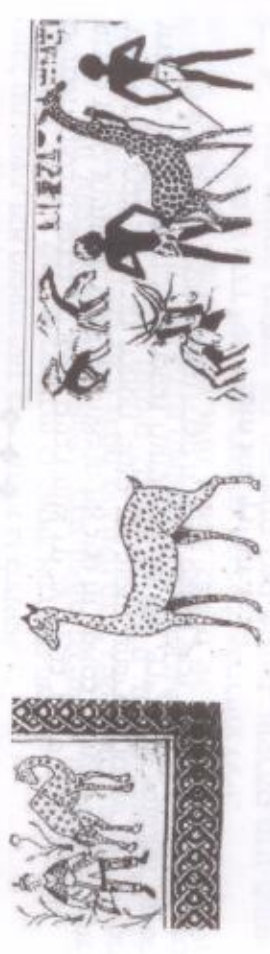
בתמונות לעיל: מימין - חובלת גירף כמנחה במצרים העתיקה (ראה הע' 8). באמצע - איור של גירף מפרשה (ראה הע' 9). חובלת גירף בפסיפס כנסית הר נבו (ראה הע' 10).

רבים מהחוקרים דחו את זיהויו של רס"ג, וטענתם העיקרית היא שהגירף לא גדל בארץ-ישראל בתקופות הקדומות, ולא היתה מוכר לתושבי האזור. לדעתנו, הנחות היסוד שהתורה הזכירה רק בעלי חיים שהיו בארץ-ישראל אינה מדויקת. נראה שהתחום הגיאוגרפי רחב יותר, וכלל את כל אזור הסהר הפורה, ובכלל זה גם מצרים. מחקרים שנערכו לאחרונה מראים שהגירף היה מצוי במצרים העתיקה; בשלב מסויים נעלם ממנה, אך לאחר מכן שב אליה מאזור חשב או מלוב. על מציאותו של הגירף במצרים העתיקה ניתן ללמוד מתוך רבוי ממצאים של עצמות, כתובות סלע, איורים על קברים ועוד. יש הסבורים שהיא אף בויקה בתקופות מסוימות במצרים. 8