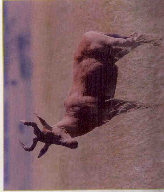
אנטילופת הבובל בשמורת הסרנגטי בטנזניה.

לובל מספר תתי-מינים והוא סבל במאות השנים האחרונות מהאדם בעקבות ציד בלתי מבוקר והרס בתי גידול, וזה שהיה בעבר בארץ ישראל כנראה כבר נכחד. הפרטים האחרונים מתת-מין buselaphus buselaphus (באנגלית - Bupal Hartebeest) נעלמו בארצות כמו מרוקו, אלג'יריה ומצרים בראשית המאה העשרים, ביחד עם טורפיהם העיקריים - האריות. כנראה שהפרט האחרון ממין נקבה, מת בשנת 1923 בגן החיות בפריס.